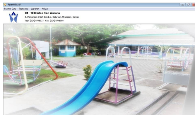
Gambar 6 Form Menu Utama

Fungsi : Untuk Mempermudah User dalam membuka Form Master, Transaksi dan Laporan-laporan.